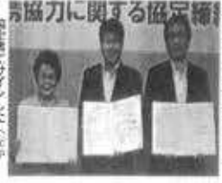
協定に関する協定書... 協定に関する協定書... 協定に関する協定書...