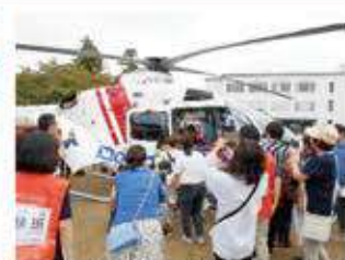
ドクターヘリ見学