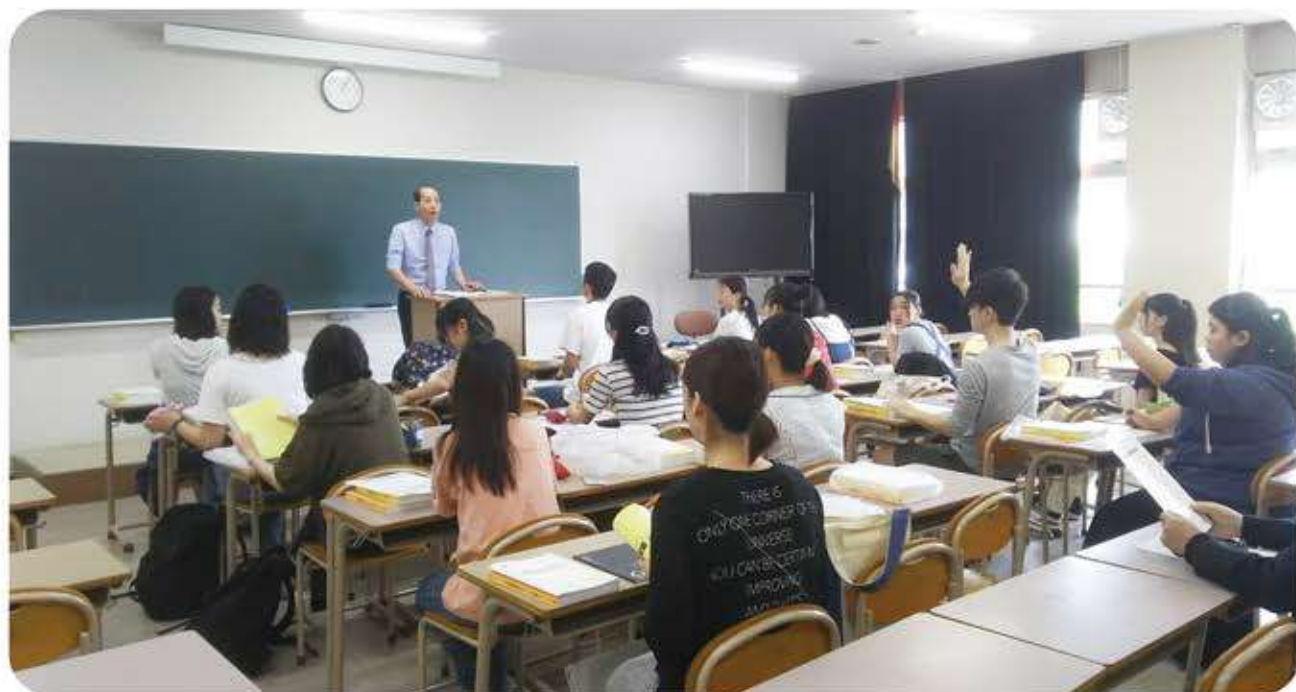
公務員試験対策講座

学生・キャリア支援センターは、一般学生はもちろんのこと、留学生や社会人訓練生も含めて、全ての学生たちが、日々の学生生活はもちろんのこと、卒業後も含めて、奈良佐保短期大学に在籍したことが、自分の人生の財産として、一生感じる事が出来るような取り組みを今後も進めていきたいと考えています。