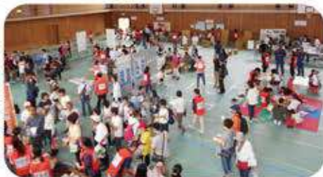
地域防災避難訓練

教育支援センターは、幅広い教養を身につけ、それぞれの専門性を高めることができるよう学生一人ひとりが大学における学修計画を立て、実りある豊かな学生生活を過ごすうえで必要な支援を、これからも行っていきたくと思っています。