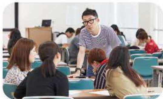
コミュニケーション演習

教育支援センターでは、在学生の皆さんが、楽しく充実した学びができるよう、また介護福祉士や栄養士、保育士などの将来の夢や希望を実現するための資格をきっちり取得できるよう、サポートを行っています。