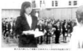
新社会人として活躍する学生たち。前列は佐保短期大学。