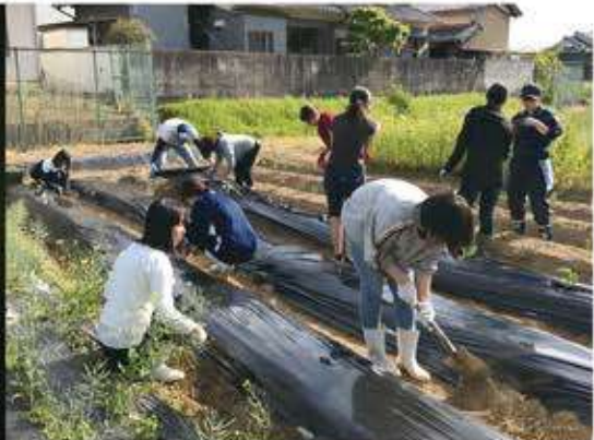
農園(夢の丘SAHOファーム)