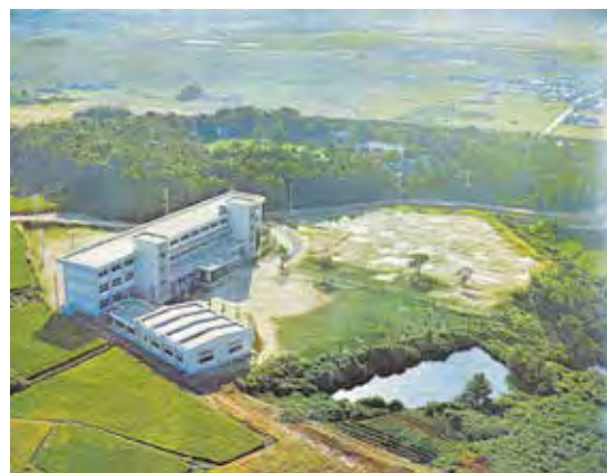
1968年キャンパス(写真2)

これまで、本学は短期大学となって以降17000人を超える卒業生を輩出しており、卒業生は保育、介護、栄養、ビジネスなど様々な現場で活躍しています。これからも建学の精神、教育理念に基づき、自己と他者を尊重し、教養識見高く、社会の進展に貢献できる人材を育成し、地域にとって“なくてはならない短期大学”であり続けたいと思います。