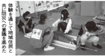
体験を通して地域住民と共に防災への意識を高めた

地域と共に学ぶ 防災避難訓練を実施 奈良佐保短期大学 奈良佐保短期大学(奈良)は10月21日、「地域防災避難訓練」を実施した。平成30年から実施している地域防災避難訓練は、「南海トラフ巨大地震」の発生を想定した実践的な取り組みで、今後の第二次避難所の支援体制の充実・強化を図り、誰もが安心して暮らせる地域づくりに資することを目的として実施した。 当日は学生や教職員など、学内参加者が162人、地域住民や協賛団体などの学外参加者が131人の合計293人が参加した。より実践的な訓練にするため、教職員を含め学内参加者は、事前告知はなく、当日に担当する班が発表された。「捜索班」や「連絡班」などの班ごとに準備を行い、訓練を開始。学生は、住民の避難を誘導し避難者を確保する作業を行った。「段