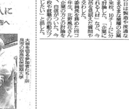
大根を切る参加者たち=奈良佐保短期大学

KBD 困窮する人に 活用する400本を加工・配布へ 奈良市農業委員会が遊休農地解消のため育てた大根約400本が、コロナの影響で廃棄が中止になるなどして配布先がなくなった。2日には、約400本の大根が奈良佐保短期大学(奈良市)の学生らに加工して大根に加工された。