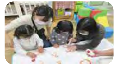
オレンジリボン 作りと一緒に

4組13人の親子を前に、絵本の読み聞かせから始まって、コロナ禍の虐待の実態の発表や虐待防止運動を表すオレンジリボンの製作などが展開されました。