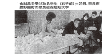
食品を受け取る学生(右手前)=29日、奈良市鹿野町の奈良佐保短期大学

奈良佐保短大が支援の食料配布 奈良市鹿野町の奈良佐保短期大学は29日、新型コロナウイルス感染症の影響で経済的に困窮している同短大生を支援するため、食料品を配布した。 奈良市のフードバンク事業、