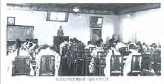
1931年佐保女学院授業風景(写真1)

1965年(昭和40年)に現在の鹿野園町に移り「教養識見ある女性を養成し、社会に貢献できる人材を育成すること」を建学の精神に掲げ、「佐保女学院短期大学」として「家政科(被服専攻、食物専攻)」からスタートし、1967年(昭和42年)には「食物栄養専攻(栄養士養成課程)」が開設され、1968年(昭和44年)に「奈良佐保女学院短期大学」の名称に変わりました。(写真2)