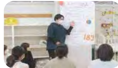
児童虐待防止月間 ポスター発表

さらに保育ソーシャルワークフィールドの学生は、児童虐待防止月間に因んで広場内でポスターセッションを実施しました。