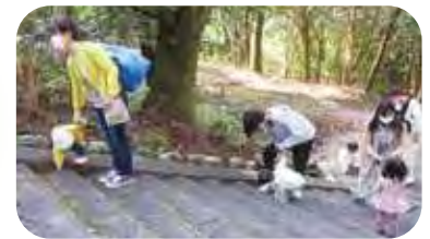
護国神社へ 秋のお散歩

さらに保育ソーシャルワークフィールドの学生は、児童虐待防止月間に因んで広場内でポスターセッションを実施しました。