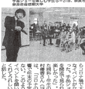
手品ショーを楽しむ学生ら=21日、奈良市鹿野町の奈良佐保短期大学

佐保短大でクリスマス会 奈良市鹿野町の奈良佐保短期大学(254人)は、池田町やクリスタルを味わった。クリスマス会を開催した。 クリスマス会を開催した。クリスマス会を開催した。