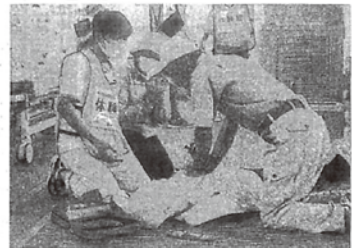
AED(自動体外式除細動器)の操作を体験する参加者=2日、奈良市鹿野町の奈良佐保短期大学