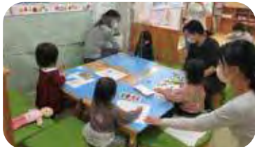
みんなで お絵描きしましょ

子育て支援センター「ゆめの丘 SAHO」は、奈良市の委託を受けた0歳からおおむね3歳までの子どもと保護者が利用できる子育てを応援する場所です。託児は実施していませんが、子育て中の親にとっては気軽に利用できる場所でもあります。さて、コロナ感染が少し落ち着いてきたころから、そろりと学生が子育て支援センター「ゆめの丘 SAHO」の広場に参加して学んでいます。「子育て支援フィールド」の学生は、週に一回2人ずつ「ゆめの丘 SAHO」の広場で利用親子と関わって学んでいます。