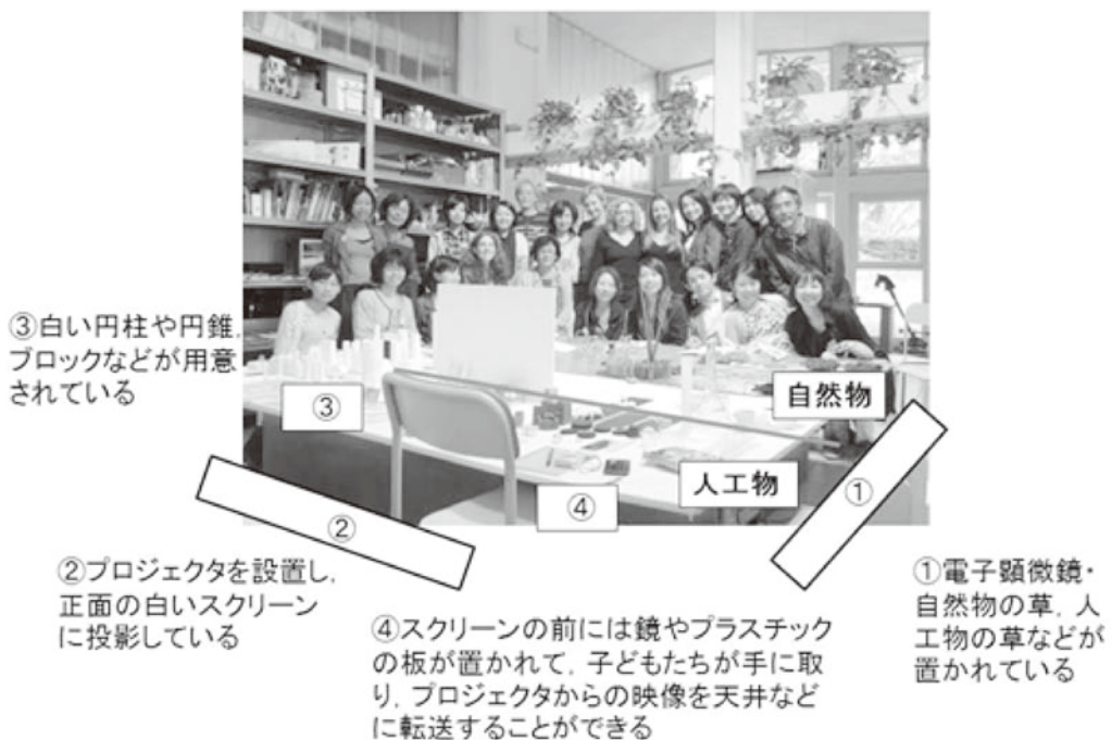
図3：ディアーナ幼児学校のアトリエ内の環境構成

レッジョ・エミリアの教育アプローチについて語るとき、通常の保育を行う保育者に加えて、ペダゴジスタとアトリエスタの存在は非常に大きい。現在、ペダゴジスタは市内の複数の乳幼児施設を担当し、全体的な調整及び統括を行っているという。アトリエリス