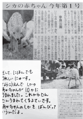
子どもたちが持ってきた切り抜きを掲示した。

園長先生は、手帳を取り出した。子どもたちの目は、その手帳に注がれる。「そうね、6月は予定が一杯だし、7月も予定が一杯だわ。8月は何もないからどうですか？」と、子どもたちに尋ねられる。すると、子どもたちは「えー、8月は夏休みやし、暑いからなあ…。他には無いですか？」と、聞き返す。「そしたら、9月は敬老会があるし、10月は運動会があるし…。でも運動会が終わったら、今のところ何もないから、10月の終わりくらいはどうですか？」と言われると「それでいいです！」と大喜びの子どもたち。秋の遠足は奈良公園に決定！と、自分たちで決めた満足感でいっぱいの子もたちだった。保育室に戻ってきてその結果を心配そうに待っていた子どもたちに「10月の終わりだったら、行けるって園長先生が言ってくれたけど、それでいい？いいと思う人は手を挙げてくださーい！」と言うと、みんな「さんせーい！」と手を挙げる。そんな子どもたちの姿をニヤニヤしながら見守った。