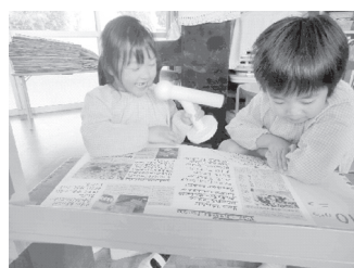
“ニュースの時間”で新聞の切り抜きを持ってきた子が読む