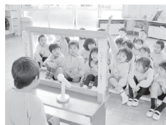
ニュースを聞いて質問をする子どもたち

自分で新聞の記事を読めない子どもたちが、喜んで園に持ってくるのは、きっと保護者の方々がいろいろな記事をわかりやすく説明してくださっているのだと思う。