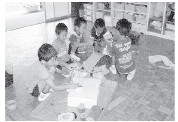
カブトムシの遊びの場が出来上がり遊んでいるところ

ショウが「もういいな。カブトムシ」と遊び場に連れてくると、みんなでカブトムシを這わせたり相撲をさせたりして遊ぶ。