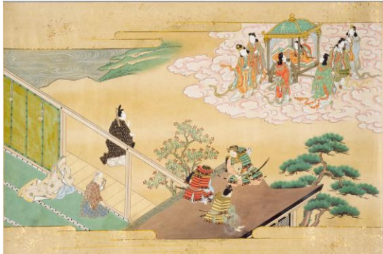
付図 1 国立国会図書館蔵 竹取物語上 37) コマ番号 3